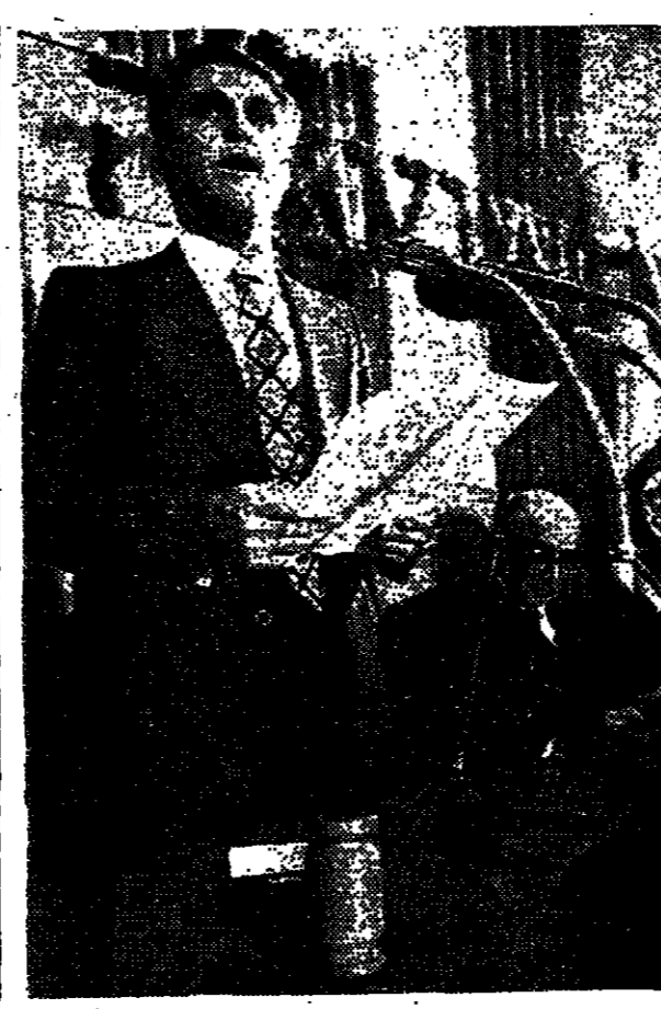
נורווגיה מיחתה בפני ישראל

ואי-בג"מ, 6 (צ"פ, צ"ר, יו"פ). ועדת ביה"ב הוסמכה לדרוש מניכסון עדות ההחלטה - ברוב של 410 נגד 4.